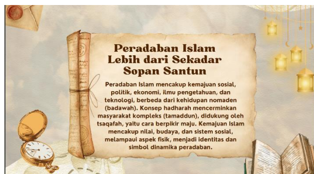
Gambar 2. Contoh hasil tugas siswa memanfaatkan platform ChatGPT dan Canva