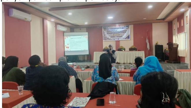
Gambar 3. Workshop Pengembangan Perencanaan Pembelajaran

Setelah tahap sosialisasi, dilaksanakan workshop intensif yang berfokus pada pengembangan perencanaan pembelajaran berbasis budaya lokal dengan pendekatan pembelajaran mendalam. Dalam kegiatan ini, guru dilatih untuk menganalisis capaian pembelajaran pada jenjang PAUD serta mengidentifikasi aspek-aspek yang dapat diintegrasikan dengan nilai-nilai budaya lokal. Selanjutnya, guru mempraktikkan penyusunan tujuan pembelajaran yang mengaitkan dimensi profil lulusan dengan konteks budaya setempat, sehingga pembelajaran menjadi lebih bermakna. Guru juga dibimbing dalam merancang pengalaman belajar yang mengikuti tahapan memahami, mengaplikasi, dan merefleksi dengan memanfaatkan berbagai sumber budaya seperti permainan tradisional, cerita rakyat, dan kerajinan tangan Suku Kamoro. Selain itu, guru dilatih mengembangkan asesmen yang holistik dan kontekstual untuk mengukur perkembangan anak secara menyeluruh. Kegiatan ini diakhiri dengan simulasi pembelajaran, di mana guru menerapkan perencanaan yang telah disusun, kemudian melakukan refleksi bersama serta memperoleh umpan balik dari fasilitator dan sesama peserta untuk penyempurnaan praktik pembelajaran.