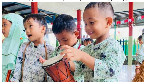
Gambar 4. Proses Pembelajaran Memainkan Alat Musik Tradisional

Sebagai bagian dari implementasi pembelajaran, anak-anak dilibatkan dalam kegiatan eksplorasi budaya Suku Kamoro yang memberikan pengalaman belajar secara langsung dan bermakna. Dalam kegiatan ini, anak-anak menyaksikan secara langsung proses pembuatan noken oleh pengrajin lokal, sehingga mereka dapat memahami nilai dan proses di balik kerajinan tradisional tersebut. Selain itu, anak-anak juga mendengarkan cerita rakyat Suku Kamoro yang dituturkan oleh guru, yang tidak hanya memperkaya pengetahuan mereka tetapi juga menumbuhkan imajinasi dan pemahaman budaya. Pengalaman belajar semakin lengkap ketika anak-anak diberi kesempatan mencoba memainkan alat musik tradisional seperti tifa, serta berpartisipasi dalam gerakan sederhana Tari Seka yang biasa ditampilkan dalam upacara adat masyarakat Kamoro. Kegiatan pembelajaran berbasis budaya ini menghadirkan pengalaman autentik yang tidak dapat diperoleh hanya di dalam kelas, sekaligus memperkuat keterkaitan antara pembelajaran di sekolah dengan kehidupan nyata di lingkungan masyarakat.