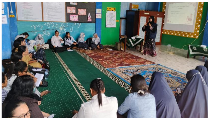
Gambar 2. Proses Sosialisasi

diintegrasikan secara kontekstual melalui pendekatan pembelajaran mendalam. Kegiatan dilanjutkan dengan diskusi interaktif berupa sesi tanya jawab yang memberikan ruang bagi guru untuk memperdalam pemahaman serta mengeksplorasi kemungkinan penerapan dalam praktik pembelajaran di kelas.