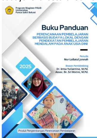
Gambar 5. Buku Panduan

Hasil analisis kebutuhan menunjukkan adanya kesenjangan antara harapan dan praktik pembelajaran berbasis budaya lokal dengan pendekatan pembelajaran mendalam di TK Integral Al Amiin I Hidayatullah Timika dan TK Satrad 243 Timika. Sebagian besar guru, yaitu sekitar 75%, belum memahami secara mendalam konsep deep learning dan penerapannya pada pendidikan anak usia dini. Data angket juga mengungkapkan bahwa 58,3% guru kurang memahami pembelajaran mendalam dan 58,4% kurang memahami budaya lokal Kamoro dan Amungme. Selain itu, 83,3% guru menyatakan keterbatasan sumber referensi budaya lokal, sehingga integrasi budaya dalam pembelajaran masih tergolong rendah. Temuan ini menegaskan pentingnya pengembangan buku panduan yang dapat membantu guru mengintegrasikan pembelajaran mendalam dengan budaya lokal secara lebih sistematis dan kontekstual.